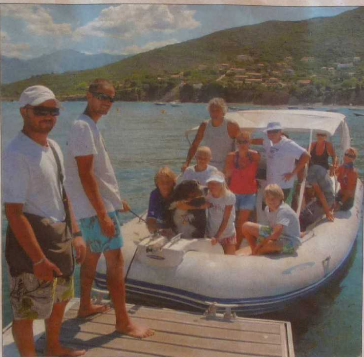
Départ vers la réserve de Scandola pour ce groupe de touristes hollandais.

Paesi è paisoli chez votre marchand de journaux - 9,90 euros