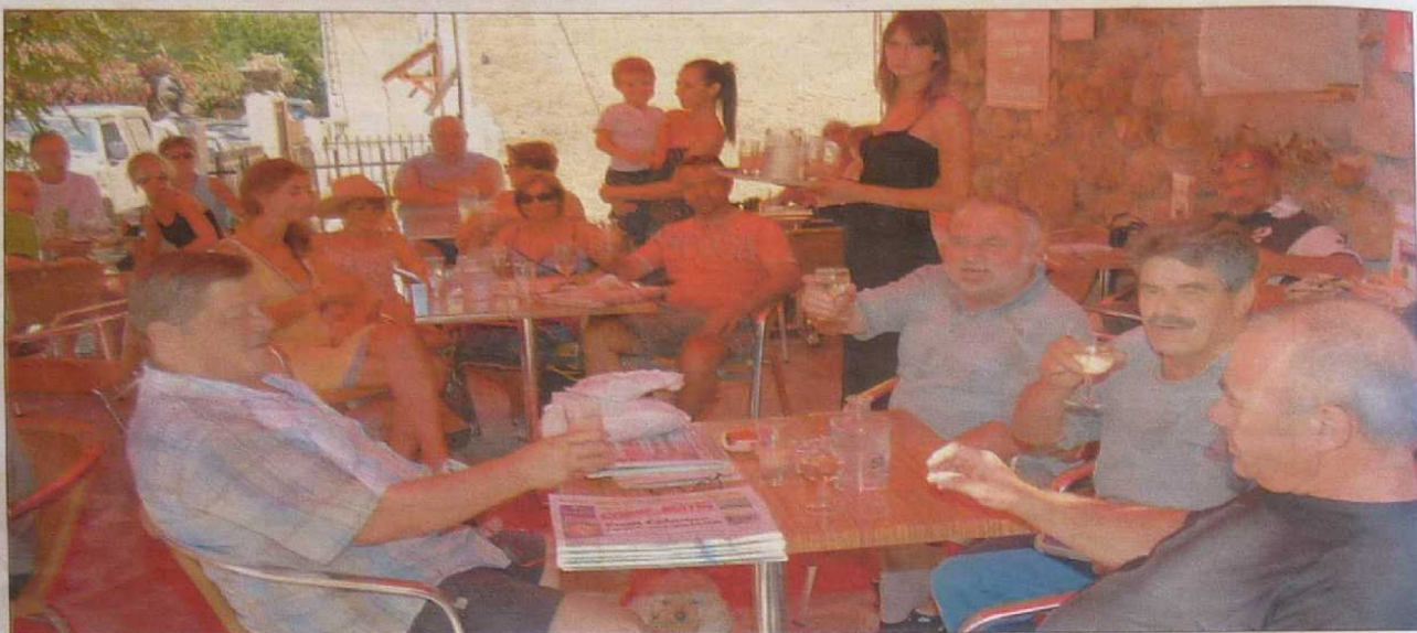
Sur la terrasse de A Piazzetta, l'un des deux bars du village, villageois et vacanciers se retrouvent quotidiennement.