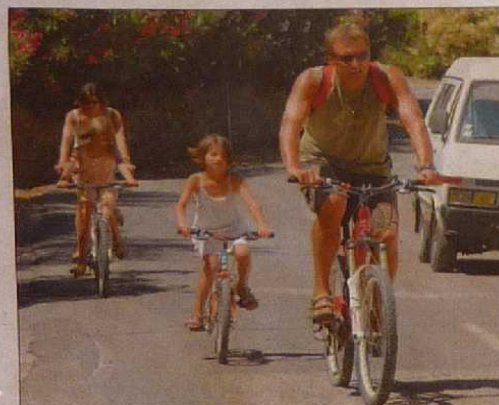
Le sport en famille...