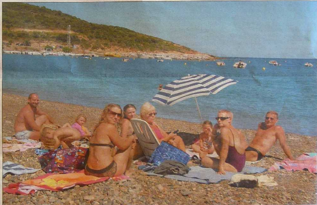
Retrouvailles sur la plage de galets située à deux pas du centre du village.