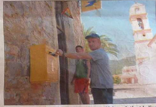
Un temps menacé, l'agence postale de Galéria maintient le lien social dans le centre du village.