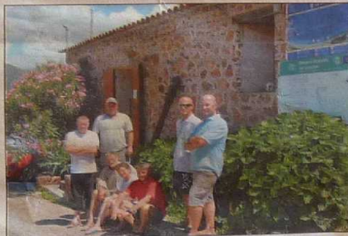
Les locaux du Parc naturel régional accueillent en ce moment six scientifiques venus de Sophia-Antipolis.