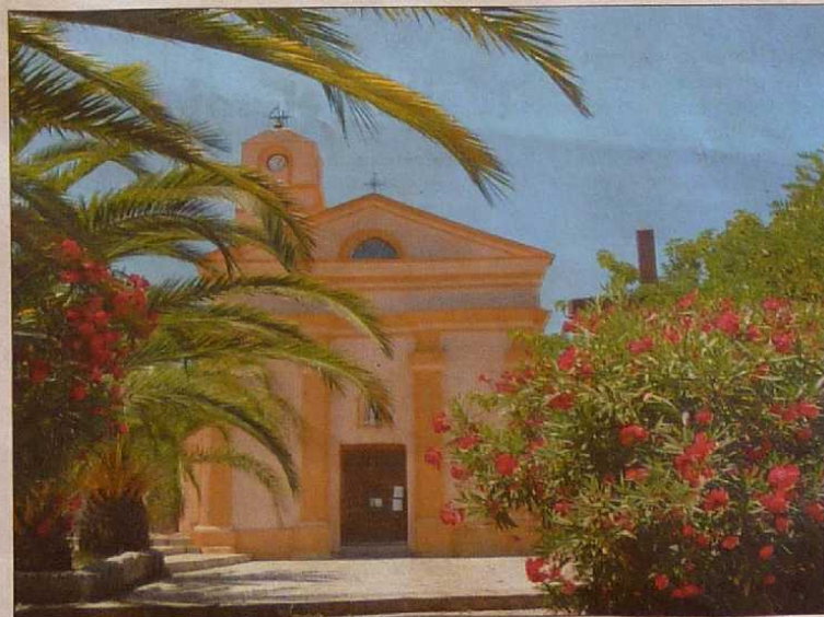
L'église paroissiale Sainte-Marie.