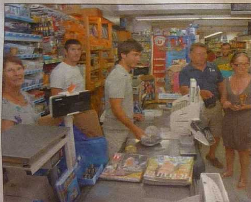
Chez César, dans le centre, un autre commerce de proximité.