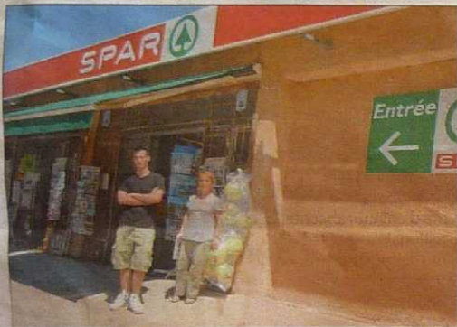
À l'entrée du village, une des deux supérettes.